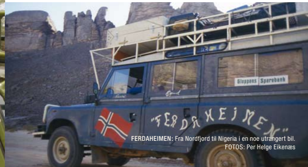
FERDAHEIMEN: Fra Nordfjord til Nigeria i en noe utrangert bil.

- En av gutta, Jarand, var veldig glad i bøker og hadde lest mye om Afrika. Vi ble inspirert av det han fortalte. Selv hadde jeg knapt forutsetninger for å drømme om Afrika. Den gangen virket kontinentet veldig langt unna. Både geografisk og på andre måter. At vi bestemte oss for å kjøre var først og fremst et resultat av eventyrlyst og et ønske om å gjøre noe få andre hadde gjort før oss. I ettertid er det turen med elvebåt opp