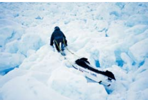
DRØM? Finn din egen pol, oppfordrer Kagge. Slitt i isødet står neppe øverst på drømmelista til folk flest.

- Min erfaring er at det aller viktigste ikke er å nå målet eller å bli til noe, men å være underveis, sier drømmeren, polfareren, forleggeren, kunstsamleren og familiemannen Erling Kagge.