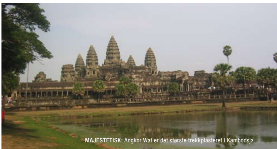
MAJESTETISK: Angkor Wat er det største trekkplasteret i Kambodsja.